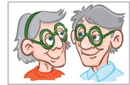
Oma und Opa